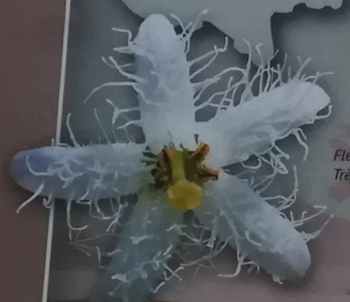
Fleur de Trefle d'eau